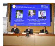
Stoccolma L'annuncio ANSA

● Un premio Nobel nel segno dell'economia sociale. Assegnato a tre economisti che con la ricerca empirica hanno smontato la credenza, in voga fino ai primi anni '90, secondo cui il reddito minimo per legge, tema attualissimo in Usa o in Italia, rischia di colpire l'occupazione, o l'afflusso di immigrati fa crollare gli stipendi dei nativi a bassa specializzazione. E stabilisce con certezza che le risorse investite nella scuola sono decisive sul futuro degli allievi. Ha un risvolto politico - ristabilire l'economia come scienza empirica in anni segnati dal negazionismo - la decisione annunciata dall'Accademia reale svedese delle Scienze, che ha assegnato il Premio Nobel per l'economia 2021 al canadese David Card, all'israelo-statunitense Joshua D. Angrist e all'olandese-statunitense Guido W. Imbens. Al primo, che insegna a Berkeley, per «il suo contributo empirico alla ricerca economica del mondo del lavoro». I suoi studi «hanno sfidato la saggezza convenzionale». A Angrist e Imbens, docenti al Mit e ad Harvard, per «i loro contributi metodologici alle analisi di correlazione causale». Un Nobel che premia quella che,