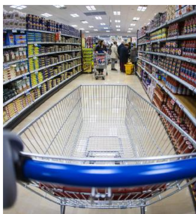
Consumi Un carrello vuoto in una corsia di un supermercato

ta» e per questo faticano a trovare la manodopera necessaria per aumentare la produzione. Sempre sul fronte delle aziende, un'altra ombra all'orizzonte potrebbe essere quella della difficoltà a reperire le materie prime: secondo Nomisma per comprendere gli eventuali riflessi sulla produzione bisogna infatti attendere il dato di settembre, dove la carenza di materie prime e le strozzature nelle catene del valore si sono fatte più pressanti. Uno spettro, questo che inquieta anche il presidente di Confindustria, Carlo Bonomi. Pur riconoscendo che i risultati del Pil «vanno oltre ogni nostra aspettativa» avverte infatti che «ci sono importanti ombre sulla ripresa, tra tutte la difficoltà del reperire le materie prime e i costi energetici». Anche se con dubbi sul futuro, le imprese sembrano comunque avere una visione più rosea rispetto alle famiglie. Ne dà conto un sondaggio condotto da Confindustria in collaborazione con Metrica Ricerca secondo cui le principali paure degli italiani riguardano gli aumenti di tasse e prezzi. Da qui alla fine dell'anno, insomma, gli imprenditori sono più ottimisti (42,7%) rispetto alle famiglie (24,3%).